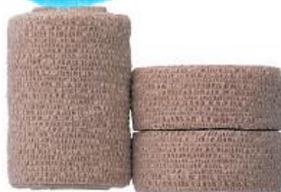
自着性包帯 大：450円 (税抜) 小：250円